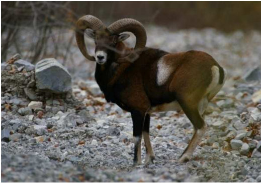
Mouflon des Monges

Après vous être garé sur la place de Reynier, joli village de montagne rattaché depuis les années 1970 à la commune de Bayons, prendre la route de Beaudinard que vous quittez rapidement par le chemin d'accès aux « Granges ». Continuer sur ce sentier parsemé de fossiles et de restes de canalisations en argile qui acheminaient l'eau, source de vie, jusqu'à Reynier. 1h30 plus tard vous atteignez les ruines de Dalmas. Descendre en longeant le ravin de l'adret jusqu'au Gaynes, ferme encore utilisée de nos jours par quelques troupeaux. Rattraper la route d'accès à Beaudinard, petit village aux pieds des Monges, que l'exode rural a failli faire disparaître, et dans lequel un gîte d'étape a été aménagé. Revenir par cette piste qui surplombe le torrent de Reynier pour rejoindre votre point de départ.